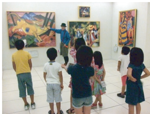
写真②「ナビゲーターとドイツ名画をめぐる」の様子