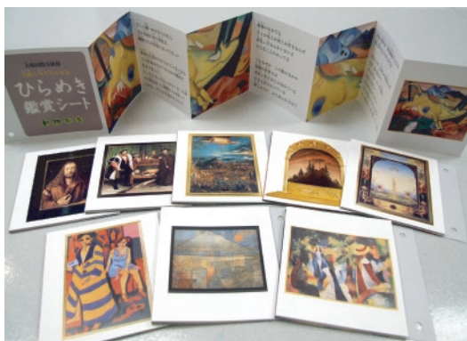
写真①「ひらめき鑑賞シート ドイツ版」9種類