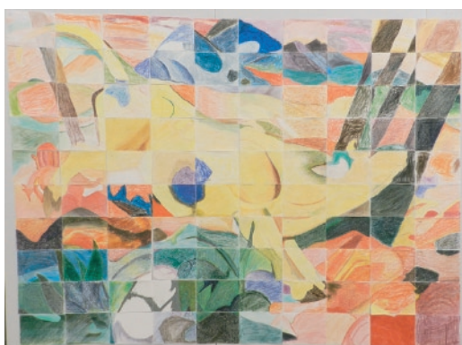
写真③ 100人名画 マルク「黄色い牝牛」