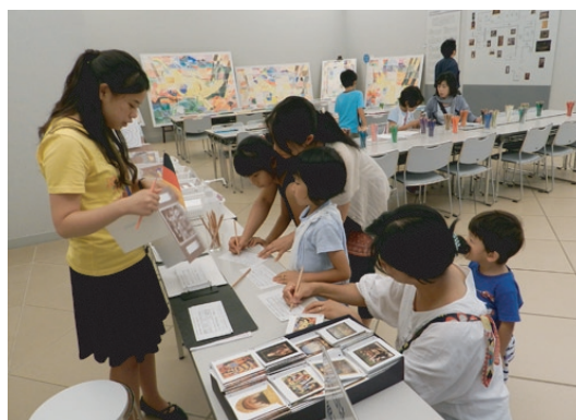
写真⑧ インターンシップの様子