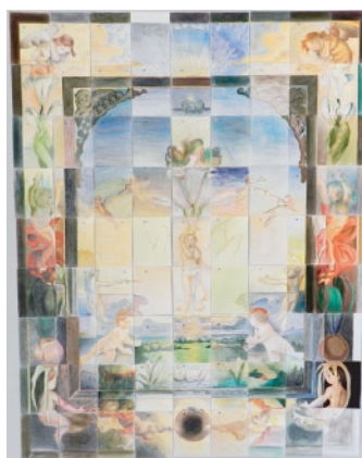
写真④ 100人名画 ルンゲ「朝」