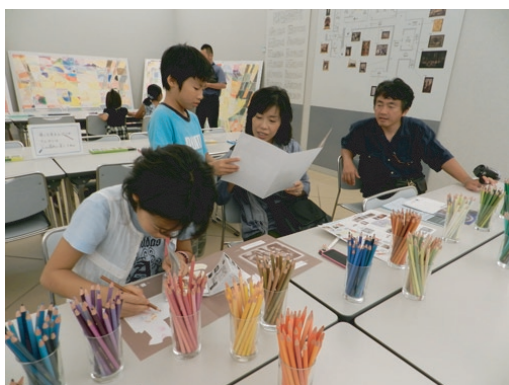
写真⑦ 親子で活動を楽しむ様子