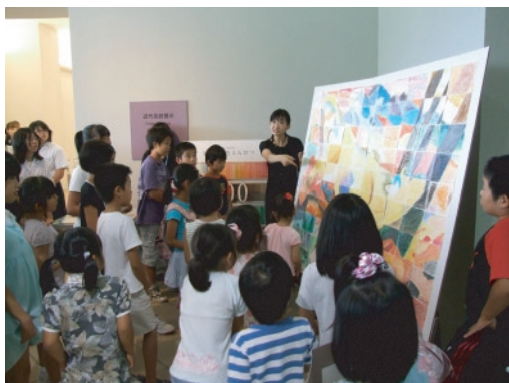
写真⑤ 「オープニングイベント 100人名画 みんなでひとつの絵を完成させよう！」の様子